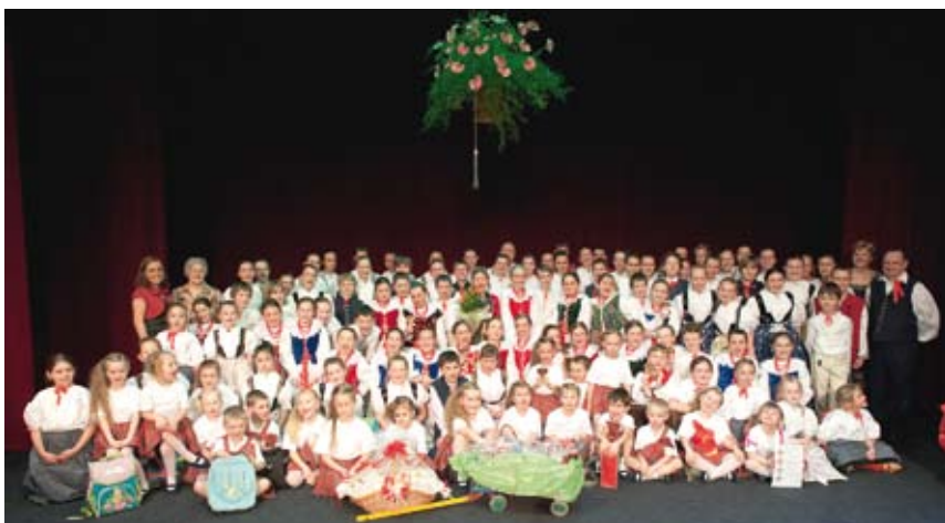
Potwierdzeniem sukcesu zespołu jest otrzymanie certyfikatu upoważniającego do reprezentowania Polski na festiwalach organizowanych przez CIOFF (Międzynarodowa Rada Stowarzyszeń Folklorystycznych, Festiwal i Sztuki Ludowej).

Pomimo iż dla niektórych dzieci koncert był debiutem na wielkiej scenie, a na ich występ surowym okiem spoglądała komisja CIOFF oceniająca ich umiejętności, młodzi artyści spisali się na medal. Potwierdzeniem ich sukcesu jest otrzymanie certyfikatu upoważniającego do reprezentowania Polski na festiwalach organizowanych przez CIOFF przez najbliższe 5 lat. W komisji zasiadła choreografka tańca ludowego Wiesława Hazuka i muzyk Jerzy Dynia.