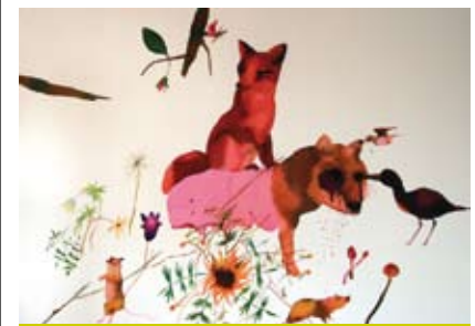
Jedna z prac artystki Basi Bańdy.

Galeria Szara, ul. Srebrna 1, zaprasza do obejrzenia wystawy prac Basi Bańdy pt. „Wiosna”. Wystawa będzie czynna do 21 kwietnia.