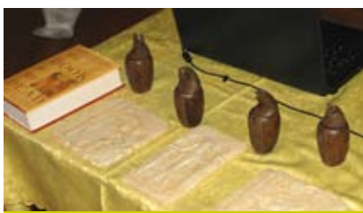
Na ostatnim wykładzie CUD dzieci przyniosły się do starożytnego Egiptu.

17 marca odbył się kolejny już wykład w ramach Cieszyńskiego Uniwersytetu Dzieci Wyższej Szkoły Biznesu w Dąbrowie Górniczej.