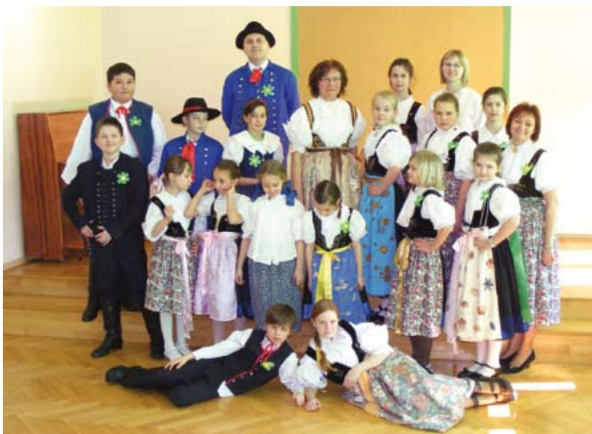
Uczestnicy konkursu „Godómy po naszymu” wraz z nauczycielami w strojach regionalnych.

Zwycięzcy mieli okazję zaprezentować swoje gwarowe umiejętności 14 marca 2012 r., kiedy to odbył się drugi etap konkursu. W etapie międzyszkol-