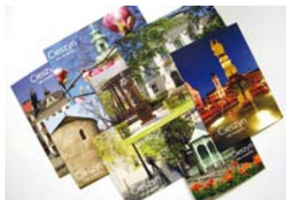
Zestaw kolorowych pocztówek ze zdjęciami Cieszyna otrzyma się za wypełnioną ankietę dotyczącą informacji o wydarzeniach kulturalnych.

UWAGA! Za każdą wypełnioną ankietę można bezpłatnie otrzymać komplet ośmiu pięknych, pamiątkowych widokówek z Cieszyna. Pocztówki można odebrać po oddaniu wypełnionej ankiety w Cieszyńskim Centrum Informacji lub Wydziale Promocji i Informacji.