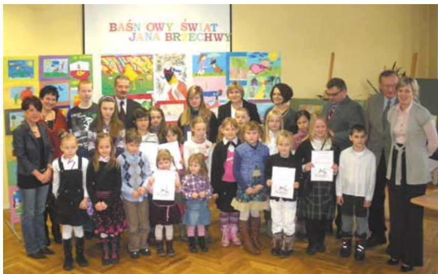
Podsumowanie konkursu plastycznego „Baśniowy świat Jana Brzechwy”.