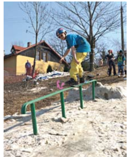
Snowboardowe ewolucje były możliwe nawet przy 25°C

Całe to „zamieszanie” nie powstałoby, gdyby nie Stowarzyszenie Freestyle Sports Union, założone w ubiegłym roku w Cieszynie. „Stowarzyszenie powstało z inicjatywy ludzi, którzy chcą i mają pomysł na rozwój i promocję sportów freestyle'owych zarówno lokalnie, jak i na terenie całego kraju. Naszą misją jest nie tylko organizacja imprez sportowych, ale także szkolenie młodych sportowców. Staramy się również, aby na stoku „Cieślarówka” powstał profesjonalny obiekt do nauki freestyle'u na nartach i