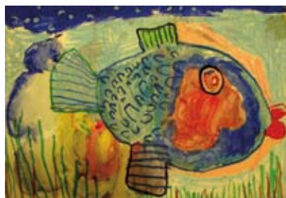
W COK będzie można zobaczyć prace dzieci z Bażanowic.

3 kwietnia o godz. 17.00 , wystawę oglądać można do 25 kwietnia. Serdecznie zapraszamy!