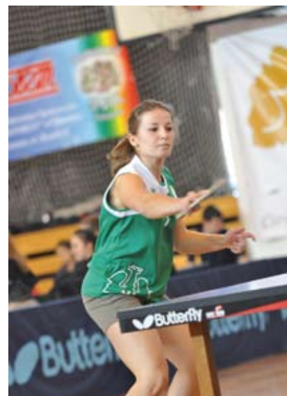
W czasie półfinałów Akademickich Mistrzostw Polski w Tenisie Stołowym